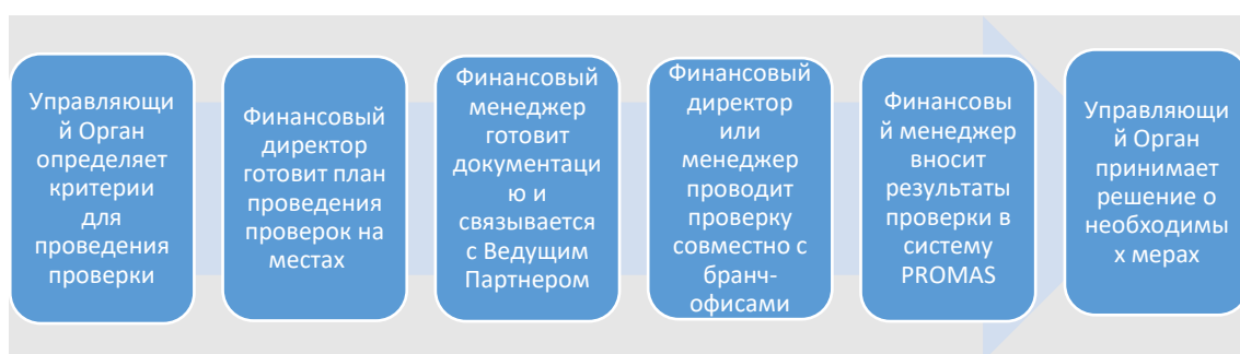
Рисунок 1. Процедура проверки площадок проекта

Проекты, отобранные для проверки на местах, приведены в Приложении 2. Приложение 3 включает подробное описание критериев отбора и процесса проверки.